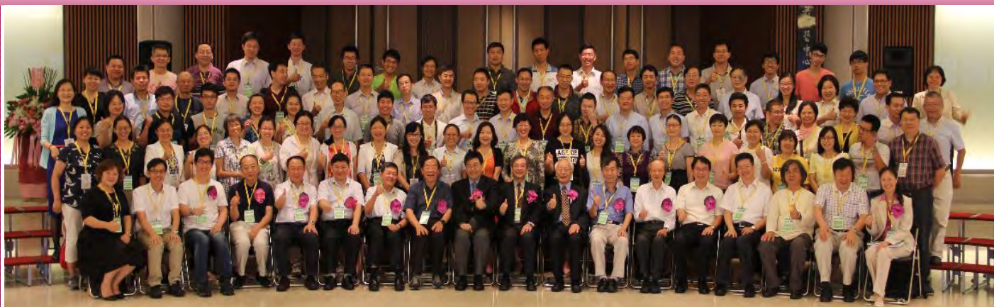
學術研討會 Ecological Conservation

主辦：中國水土保持學會 協辦：江西水土保持科學研究院 學務：[illegible]